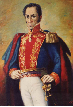
Download Full Pages Read Online LA BATALLA DE JUNÃ•N Manrique Publications LA BATALLA DE JUNÃ•N