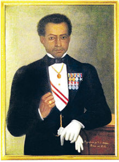
Download Full Pages Read Online Bernardo de Monteagudo Bernardo de Monteagudo